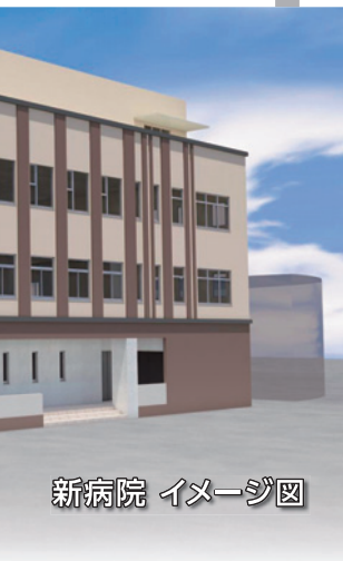
新病院 イメージ図